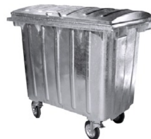
660 л, четыре колеса 200 мм, два блокируются