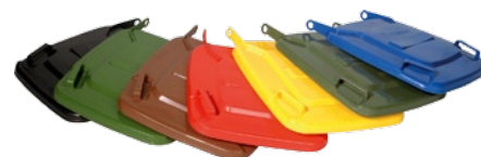
Множество вариантов цветов