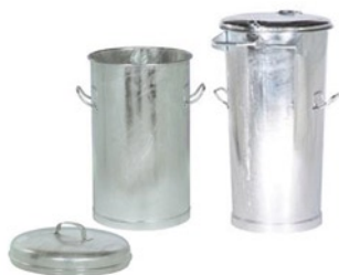
СТ 80 л, ручки по бокам, съемная крышка СТ 110 л, ручки по бокам, крышка на петлях