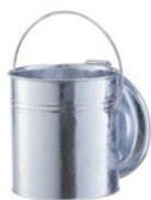
СТ 30 и СТ 40 л, крышка на петлях

Стальные контейнеры СТ изготавливаются из горячеоцинкованной стали. Могут служить, например, для сбора горячих отходов в заводских и ремонтных цехах. В контейнере СТ 240 л два колеса \phi 200 мм, а в контейнере СТ 660 л – четыре, причем два из них блокируются. Годятся для механического опорожнения.