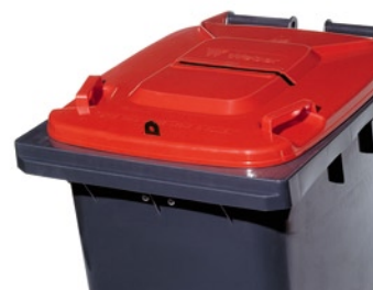
Так выглядит крышка, защищающая конфиденциальное содержимое