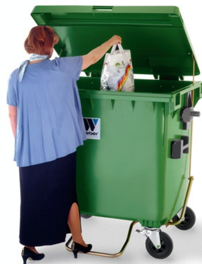
Роскошь на каждый день

Варианты замков: ригель под висячий замок, замок с внутренним трехгранником или гравитационный замок, автоматически открывающийся при переворачивании.