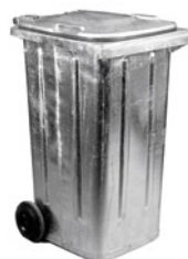
СТ 240 л, два колеса 200 мм